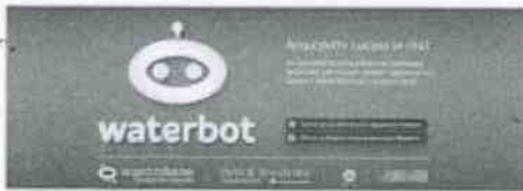
copertina.jpg ~603 KB