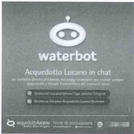
post.jpg ~444 KB